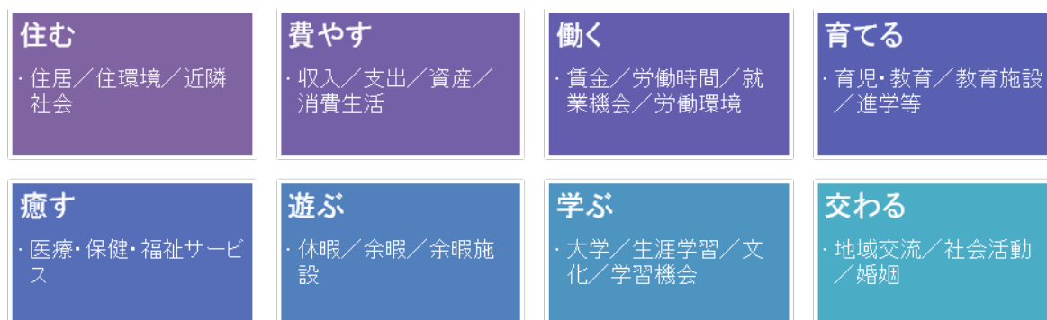
図2 地域の暮らしの姿の検討

地域ワークショップは、2035年の地域の暮らしの姿(実現している姿)を議論し、このうち、高齢社会×低炭素社会において重要度の高い姿の検討を行った。また、検討結果(意見群)について、戦略・施策(個人、市民団体、企業、研究機関、教育機関、自治体、国)等の議論を行った。