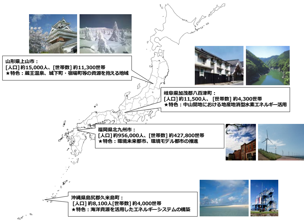
図1 地域ワークショップ開催地域

本調査は、『低炭素社会と活力ある超高齢社会』の両立をテーマとして、2035年の持続可能な社会の姿とその実現のための方策を明らかにするため、山形県上山市、岐阜県加茂郡八百津町、福岡県北九州市、沖縄県島尻郡久米島町の4つの地域にて、産官学市民からなるワークショップを開催し、地域ニーズの把握等を実施した。本調査では、地域ワークショップの実施にかかる、①開催準備、②ワークショップの運営、③ワークショップ実施に係る事務処理、④結果のとりまとめを行った。